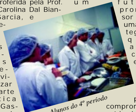
Alunos do 4º período