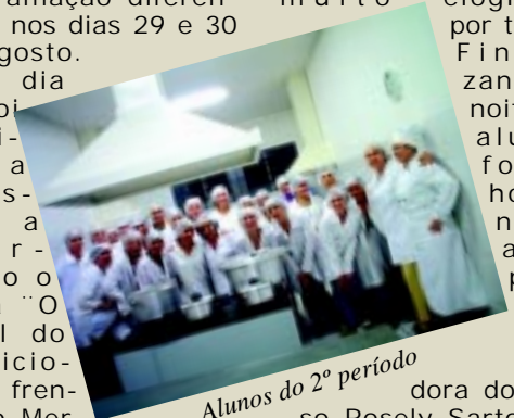
Alunos do 2º período

Parabéns às nutricionistas das Faculdades ASMEC e aos futuros nutricionistas: alunos do 2º e 4º período do curso de nutrição.