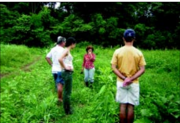
Trabalho de Campo: Agricultura Orgânica, em 19/11/2005, para o curso de Gestão Ambiental Agrária.