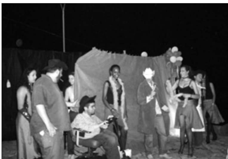
Alunos do 2º ano de Letras

Levados pelo espírito sedutor da literatura do cinema, da música e da dança desenvolveu-se um trabalho repleto das mais diversas referências em que se percebeu a preocupação dos alunos em explorar elementos da cultura americana como, por exemplo, a festa do Oscar. Para tanto, os alunos reproduziram cenas de filmes clássicos americanos explorando a garra da protagonista de "O Ven-