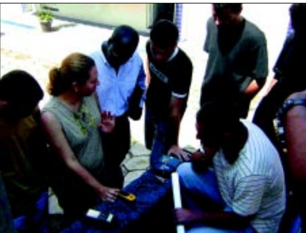
Curso de Extensão sobre Sistema de Posicionamento Global (G.P.S.), em 11/11/2005.