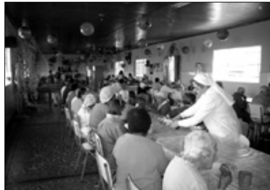
Para o ignorante, a velhice é o inverno da vida; para o sábio, é a época da colheita. (Talmude)

Com certeza, este gesto de amor e solidariedade proporcionou aos queridos "velhinhos" do asilo, uma tarde inesquecível, pois lhes foi oferecido o que mais precisam: carinho e atenção.