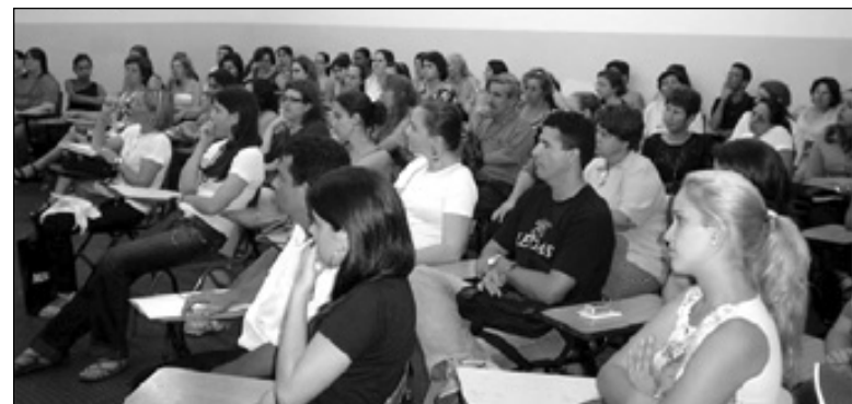
Alunos do Curso de Letras

A técnica apresentada pela artista plástica tornou o desenho uma atividade acessível a todos, bem como inspirou muitos alunos a darem continuidade aos trabalhos, em suas residências e trabalhos.