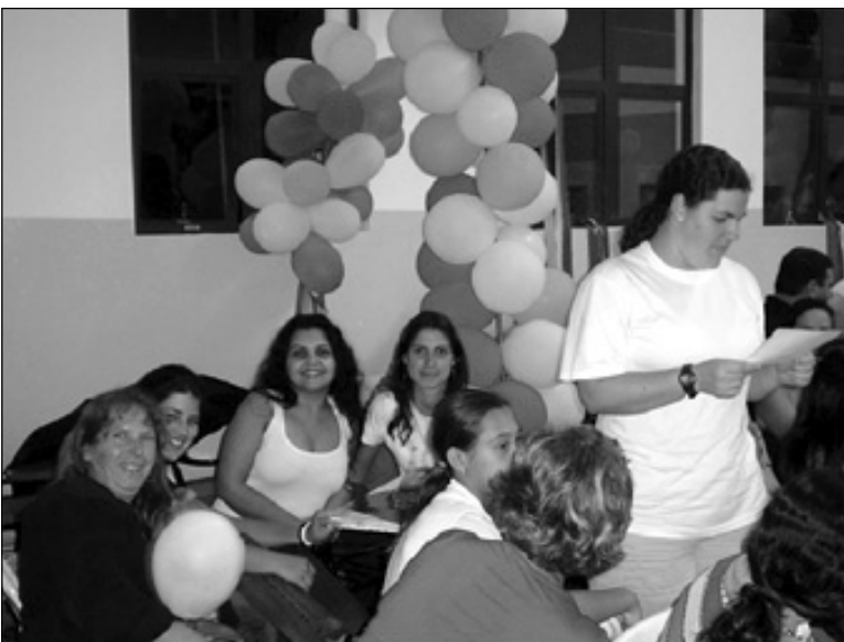
Apresentação de alunos de Letras

Parabéns à Professora Fátima e aos alunos do Curso de Letras! Vocês são CMB!!!