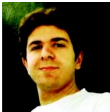
Por Aroldo Comune